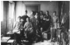
Snickerfabriken vid Lorensvik i Viggbyholm (se_ab_tahf_6280)