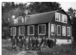
John Berglunds Mekaniska Verkstad (se_ab_sahf_LX2000-0131)