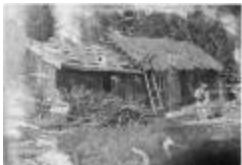
Stenhagens fähus, nytt tak 1910 (se_ab_tahf_2218)