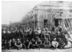
Berga bygge Västerhaninge (LX2005-1869)