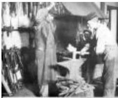
I smedjan vid Näsby Slott (se_ab_tahf_4291)