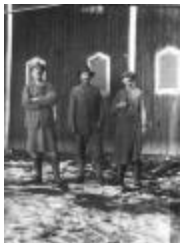
Arbetare vid Näsby Slott (se_ab_tahf_2656)