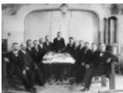
Folkets hus (se_ab_sohf_LX2001-0506)