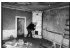
Vendelsö gård (LX2006-0442)