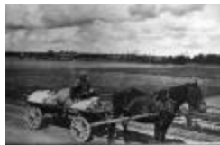
Årsta säteri (LX2005-1680)