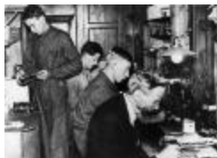
Engbergs mekaniska verkstad (se_ab_sahf_LX2000-0185)