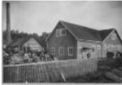
Arbetslag vid Täby Snickeri och Lådfabrik (se_ab_tahf_4038)