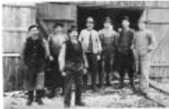
Arbetslag vid Näsby ångsåg (se_ab_tahf_4037)