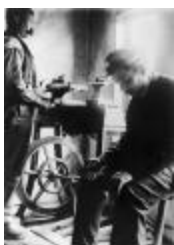
John Berglunds Mekaniska Verkstad (se_ab_sahf_LX2000-0211)