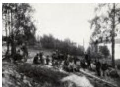
Järnvägsbygge vid Drevviken (LX2006-0301)