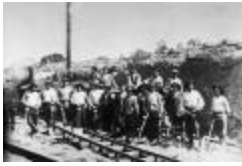
Rönninge järnväg (se_ab_sahf_LX2000-0216)