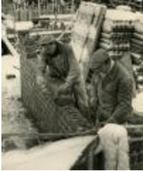
Bygge i Kevinge, på berget (se_ab_dhbf_00052)