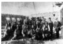
Byggarbetare Årsta ekonomibyggnad (LX2005-1689)