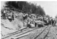
Bygge av Nynäsbanan (se_ab_hhg_09472)