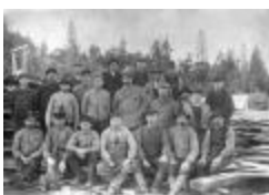
Arbetslag vi Viggbyholms ångsåg (se_ab_tahf_4036)