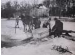
Isupptagning Näsbyviken (se_ab_tahf_4290)