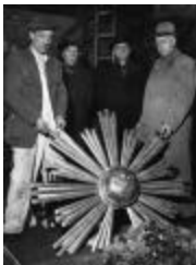
Solna kyrka (se_ab_sohf_LX2003-1051)