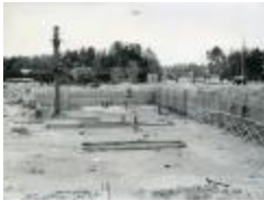
Mörby centrum byggs (se_ab_dhbf_00065)