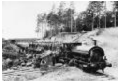
Handen grusgropen (LX2006-0316)