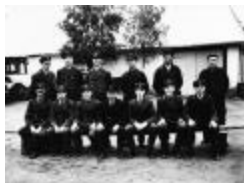
Handen, bussförare (LX2005-1686)